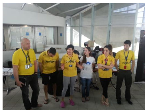
The judges

Achter de grijze gevelwand van een oud sportcomplex onthult zich een modern ogend gedeelte, waarbinnen een olympisch bad onder een laag uitstekend plafond prijkt, verlicht door hoge glaswanden achter een tribune. Met een organisatie druk in de weer, worden de laatste voorbereidingen op punt gesteld en kan de briefing beginnen.