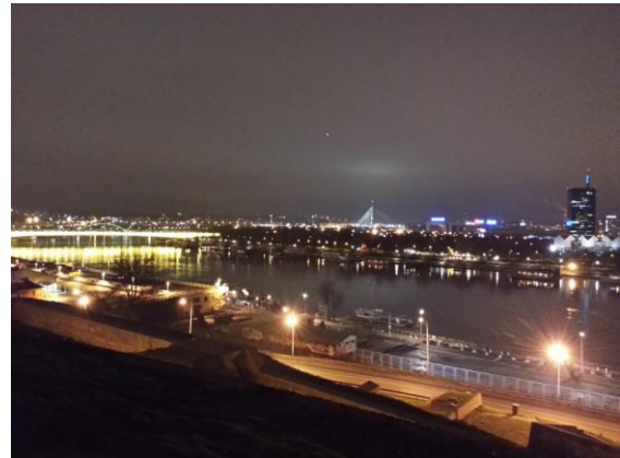
Belgrade by night door Wouter