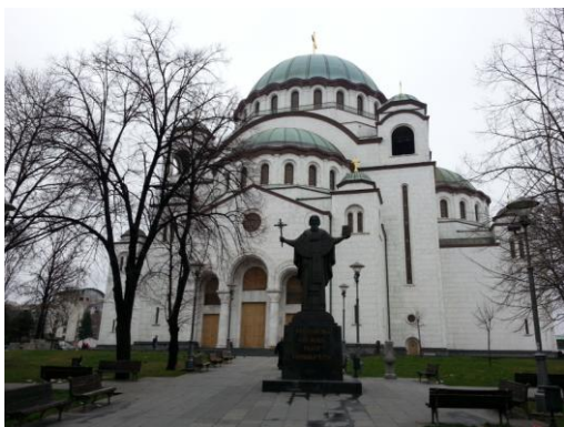
Cathedral of Saint Sava

Na een vlucht van amper twee uur, zetten wij voet aan wal in een, voor ons, nog ongekende plek van Europa. Servië is niet meteen de plek waar je aan denkt als vakantiebestemming. Maar al gauw wordt duidelijk dat we ons hierin vergissen.